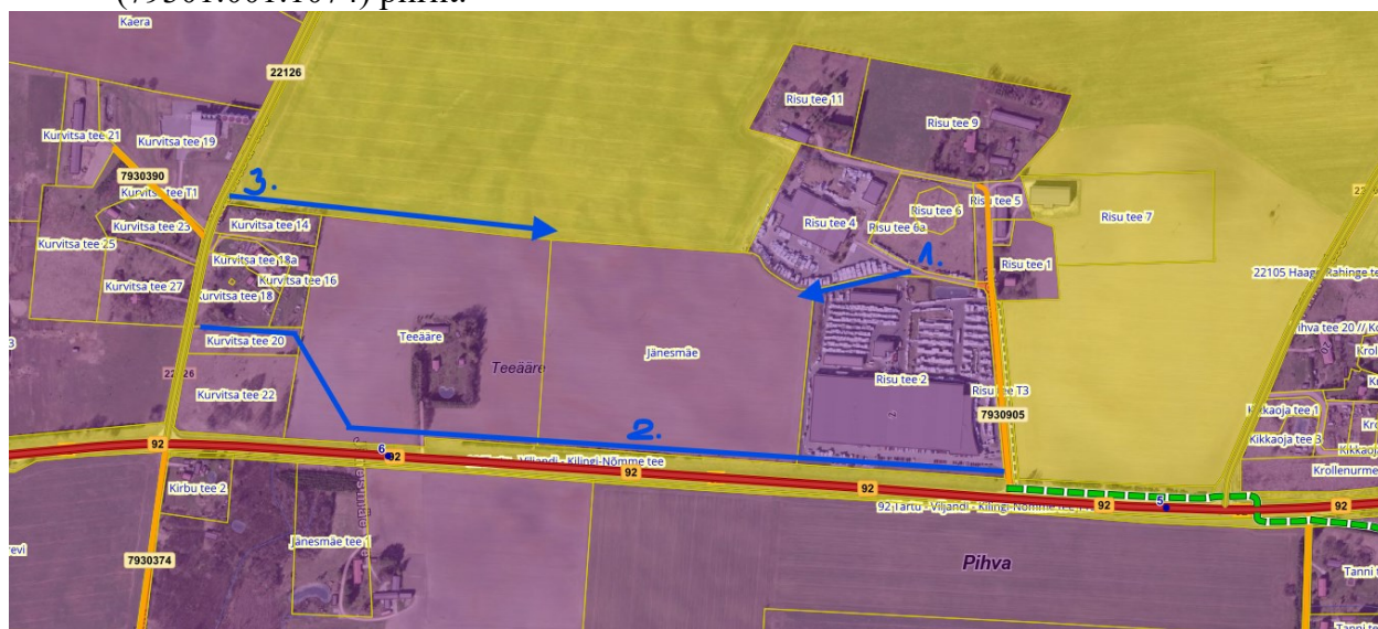
Joonis nr 2. Võimalikud juurdepääsu asukohad.